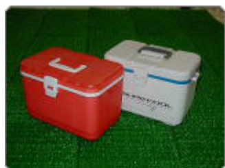
レジャーボックス