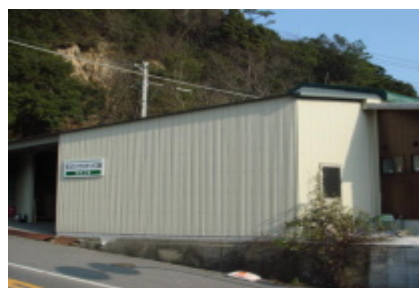
第四工場(クリーンルーム)