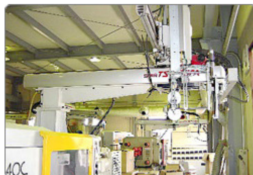
製品取出口ロボット